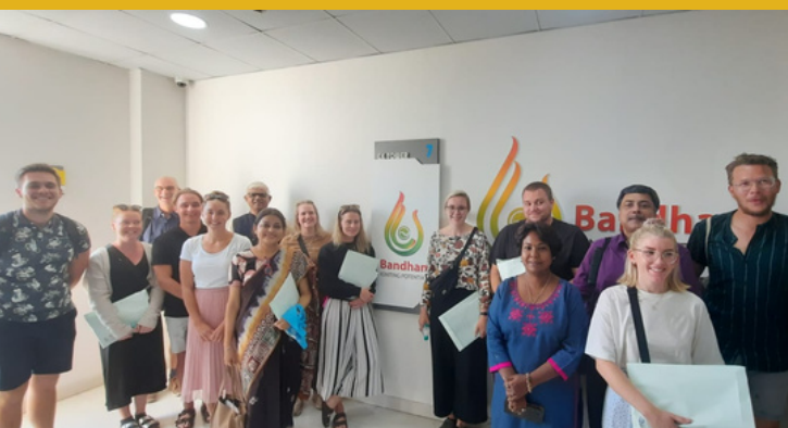
Students from Linkoping University of Sweden attends workshop at Bandhan-Konnagar