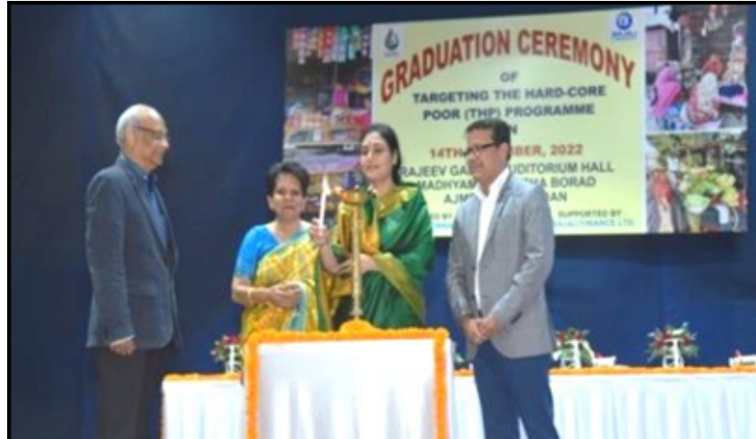
A glimpse from inauguration of Graduation Ceremony