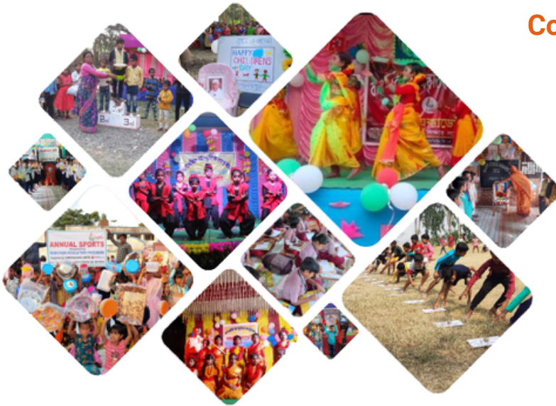
A few glimpses of co-curricular activities under Bandhan Education Programme