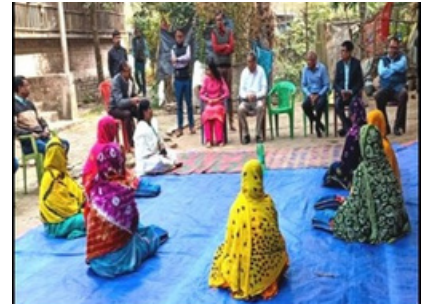
Kotak Dignitaries interacting with our programme beneficiaries