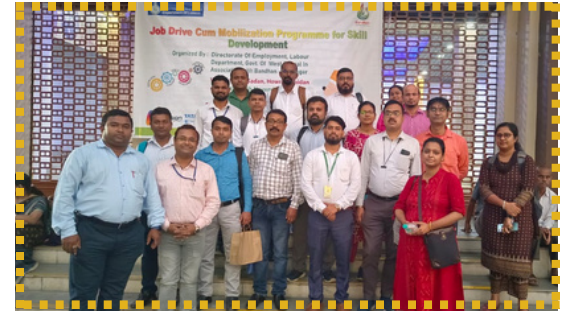
Job drive & skill development campaign